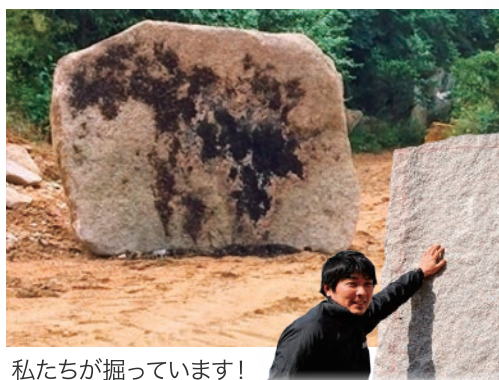
私たちが掘っています！

万成石は 優しさと気品が同居する淡紅色 の華やいだ風合いが特徴の国産石で、 さくら御影 と言われる 唯一の品種 です。この万成石を一般的な和墓の四角い形状に加工するのではなく、自然が作り出した 石本来のやわらかな形状を活かして“自然石墓” として提供。同じ形が2つと存在しない、まさに世界にひとつだけの 唯一無二のお墓 に仕上げます。