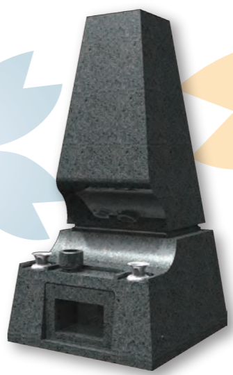
■ ドルチェ DOLCE 意匠登録第 1318703 号