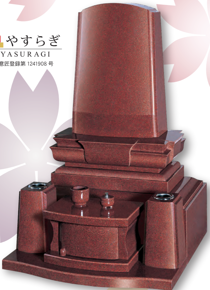
■ やすらぎ YASURAGI 意匠登録第 1241908 号