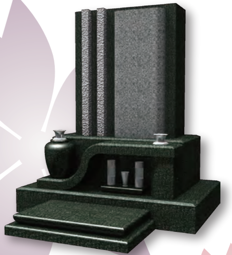
■ スイレン SUIREN 意匠登録第 1489876 号