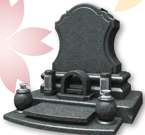
■ オクシデント OCCIDENT 意匠登録第 1403821 号