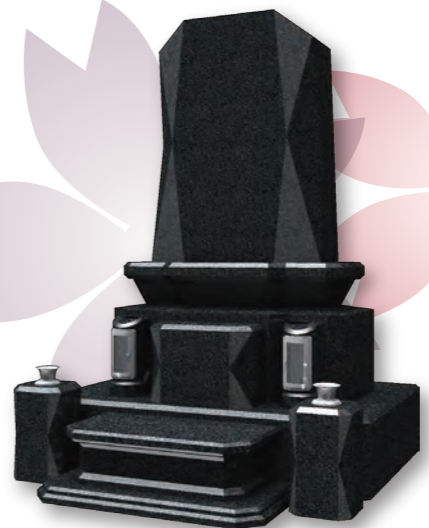
■ フォルテ FORTE 意匠登録第 1404125 号