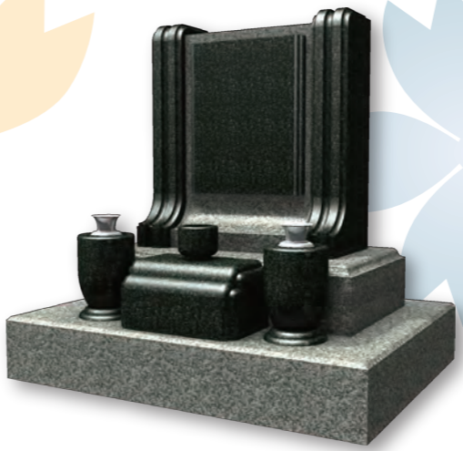
■ 月光 GEKKOU 意匠登録第 1305256 号