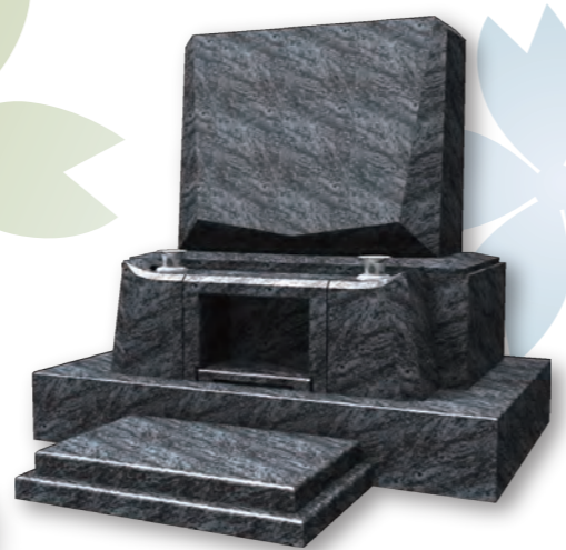
■ ペンタゴン PENTAGON 意匠登録第 1464171 号