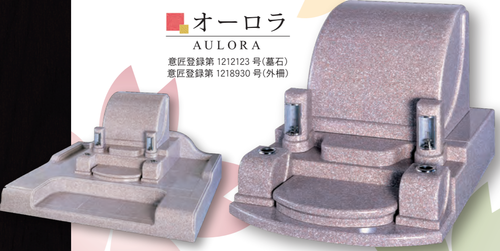
■ オーロラ AULORA 意匠登録第 1212123 号(墓石) 意匠登録第 1218930 号(外柵)