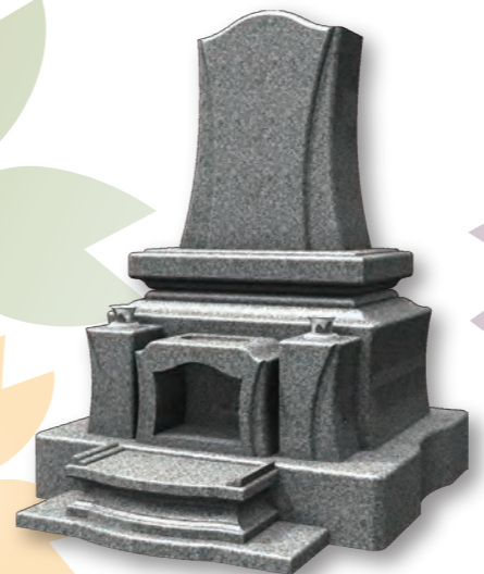
■ レグルス REGULUS 意匠登録第 1376224 号