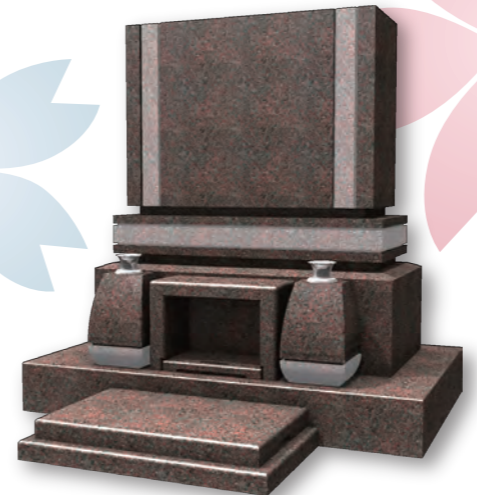
■ 紬 TSUMUGI 意匠登録第 1464172 号