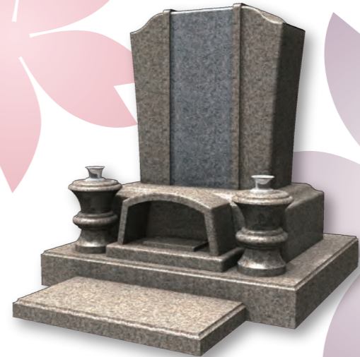
■ ナバーナ NAVANA 意匠登録第 1489875 号