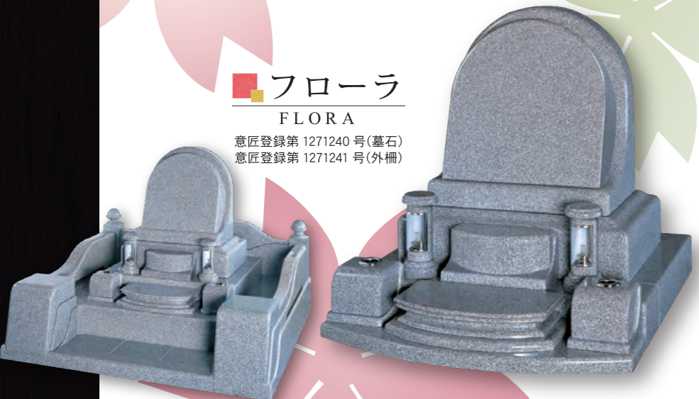
■ フローラ FLORA 意匠登録第 1271240 号(墓石) 意匠登録第 1271241 号(外柵)