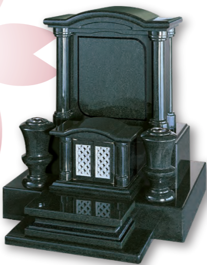
■ シリウス SIRIUS 意匠登録第 1277270 号