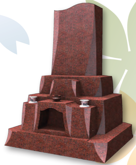
■ スピカ SPICA 意匠登録第 1353529 号